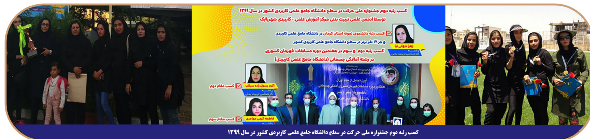
کسب رتبه دوم جشنواره ملی حرکت در سطح دانشگاه جامع علمی کاربردی کشور در سال ۱۳۹۹ توسط دانشجوی علمی تربیت بدنی مرکز آموزش علمی - کاربردی شهربابک