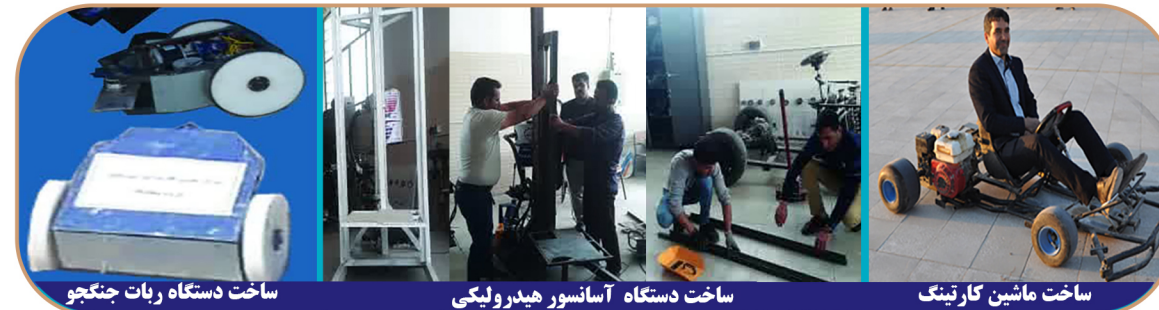
ساخت دستگاه ریات جنگجو