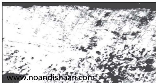
شکل ۹- پراکنده ذرات کوراندم با یک تکه بزرگ (سمت چپ) که به صورت تخلخل نیز به نظر می آید.