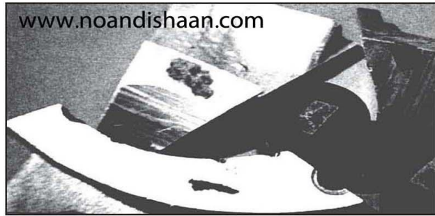
شکل ۵- نمونه ای از نقاط سخت در قطعه ریختگی. این ذرات کوراندم معمولاً از دیواره کوره ذوب ناشی می شوند.