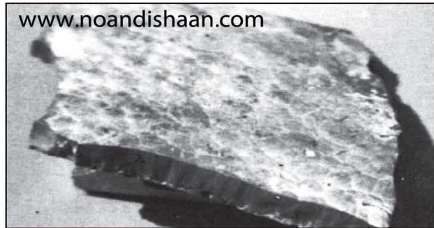
شکل ۳- تقریباً کوراندوم خالص که از دیواره کوره ذوب جدا شده است.

بنابراین کنترل ذرات سخت و عدم راهیابی آنها به داخل مذاب یکی از وظایف و اهداف مدیریت تمیزکاری کوره حمل مذاب به شمار می رود. به دلیل ته نشین شدن بسیاری از مواد سخت، یکی از راهکارهای مهم برای جلوگیری از داخل شدن این ذرات به داخل مذاب، دادن زمان کافی به آنها برای ته نشین شدن در انتهای کوره پس از تمیز کردن آن می باشد. بنابراین این موضوع، که به کوره هایی که به تازگی تمیز شده فرصت کافی جهت ته نشینی ذرات معلق در آن داده شود و مذاب آن برای مدتی مغشوش و پخش نشود، بسیار مهم و بحرانی می باشد. این زمان ممکن است ۱ یا ۲ ساعت و یا حتی در مواقعی بیشتر باشد، ولی به هر قیمتی باید از خالی کردن مذاب کوره پس از تمیز کردن آن پرهیز شود و از هر دقیقه برای ساکن نگه داشتن مذاب استفاده کنید، حتی اگر از زمان ایده آل نیز کمتر باشد.