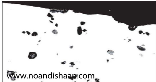
شکل ۷- آلیاژ ۳۸۰ با کوراندم پراکنده شده که بصورت شن و ماسه به نظر می رسد. احتمالاً ریختگی پس از تمیز نمودن کوره انجام شده.