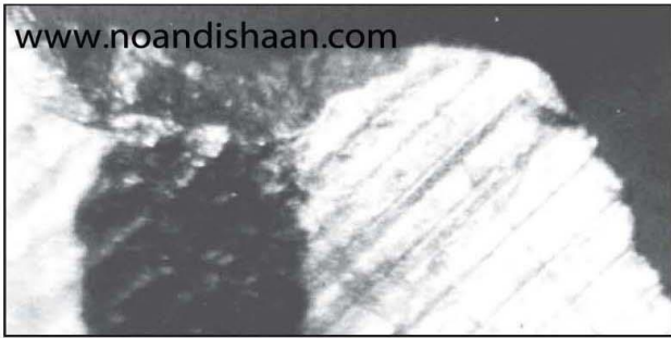
شکل ۶- کوراندم خالص بزرگی که در بیستون موتور دیده می شود.