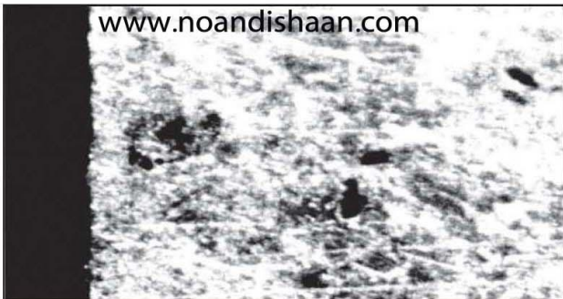
شکل ۸- کوراندم بسیار ریز که باعث خوردگی شدید ابزار می گردد.