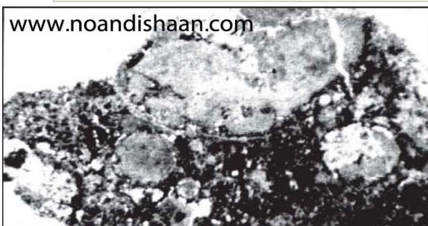
شکل ۱۰- ناخالصی کوچکی با بزرگنمایی ۲۵ برابر نشان داده شده است که مخلوطی از اکسید آلومینیم (خاکستری مایل به مشکی)، اصلاح کننده (سفید) و آلیاژ پایه (خاکستری روشن) می باشد.