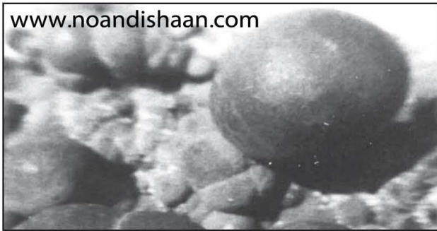
شکل ۴- توپهایی قارچ مانند از کوراندوم خالص که تحت حرارت الکتریکی در انتهای کوره شکل گرفته‌اند.